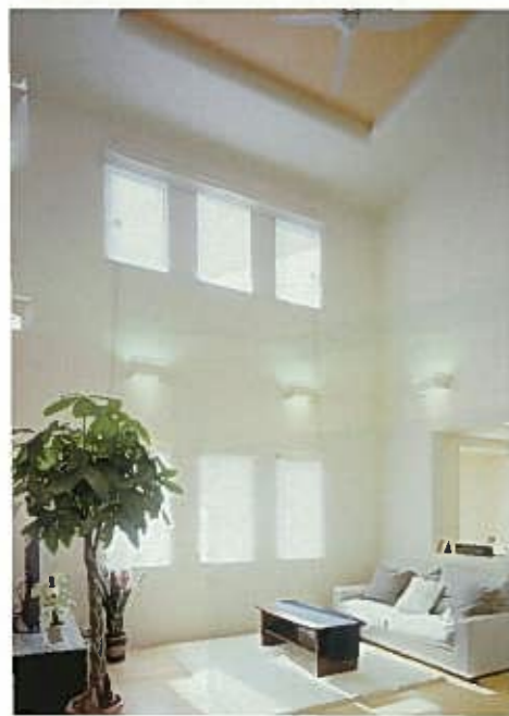
左/全面吹抜けと2層の3連窓が明るさと開放感にあふれた極上のくつろぎ空間を創出。