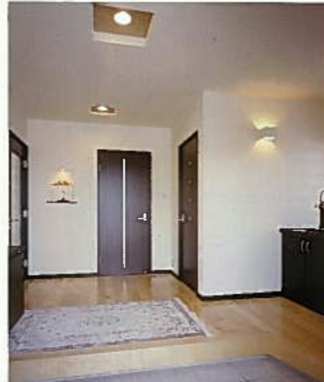
上り框をL字に配して、ゆったりとしつらえた玄関ホール。正面にはニッチの飾り棚をさりげなく。