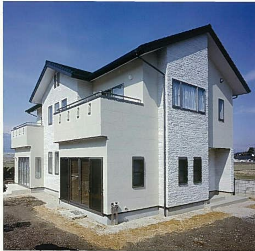
上品で落ち着いた白壁に左右対称のデザインが美しい。南面のファサードはリビング部分をセットバック。構造材には防虫加工なしで使えるヒバ4寸角を使って高耐久のつくり。