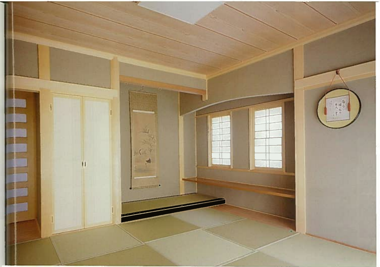
ホールから踏み込みを使い、直接出入りできる客用和室。床の間と一文字棚を配した出書院で格式あるつくり。畳はモダンな市松模様。