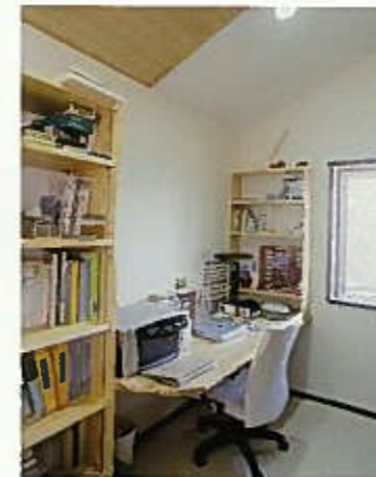
主寝室とは同スペースながら、視覚的に分離して配置した広い書斎コーナー。2面開口なので明るさも十分。