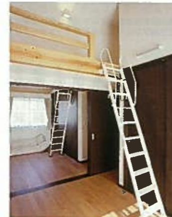
ロフトを設置した子供室。間仕切り壁ではなく、建具の仕切りでのびのびとした空間に。