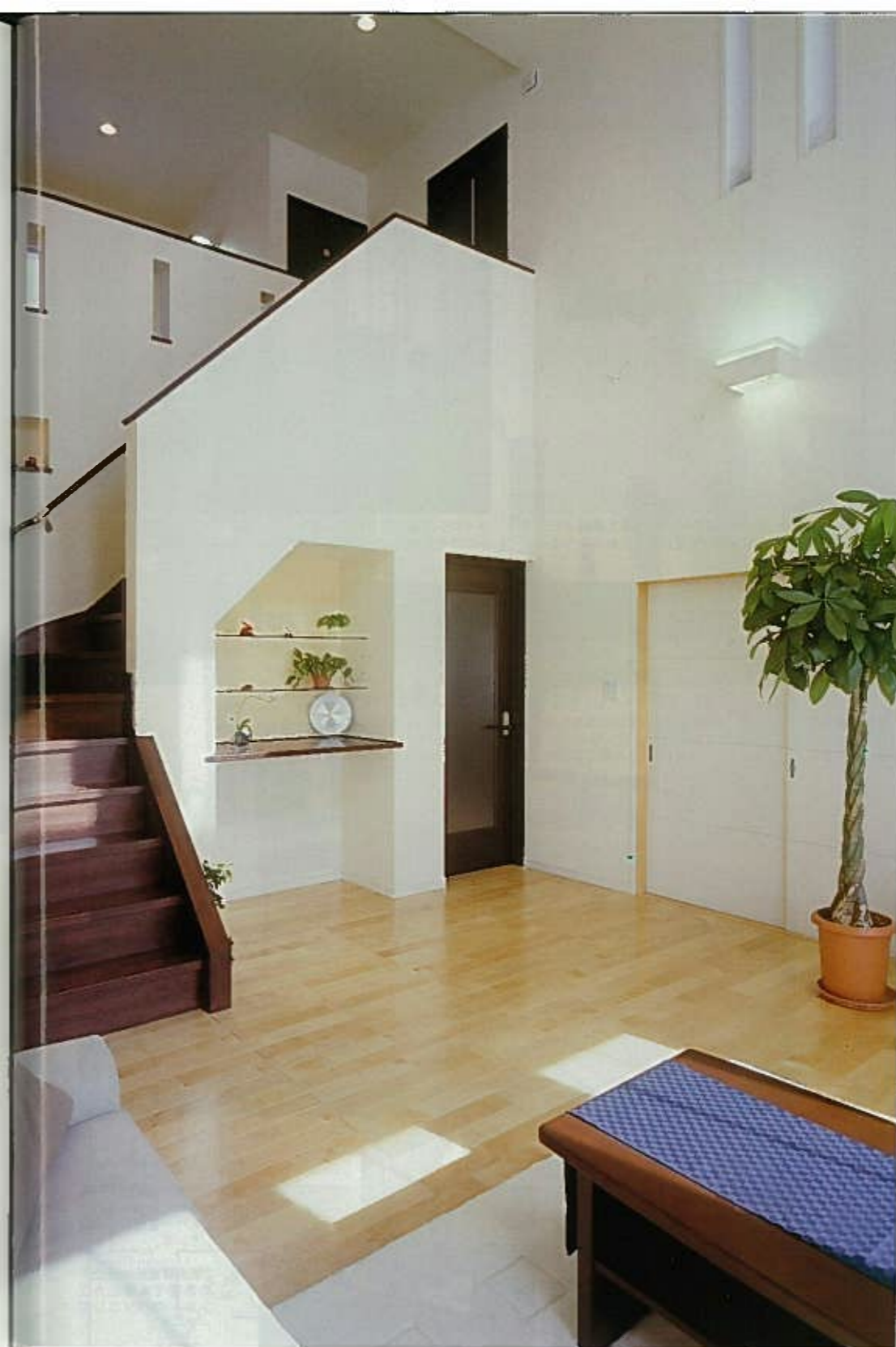
スカイシステムの活用、ナチュラルな心地良さを実現

は気密・断熱性に優れた開口部から太陽熱を取り入れて室内を暖房し、さらに生活熱や地熱を活用するため、使用木材やコンクリート基礎耐圧盤で蓄熱を利用。春秋はさわやかな外気とひんやりとした土間を組み合わせ、年間を通じて心地良い室内環境を実現しています。冬は熱交換器を利用するため、少しの熱量で全室暖房が可能。室内の温度差もわずかで、ヒートショックの心配がありません。また屋内で発生するガスやシックハウス症候群の原因となる有害物質を戸外に排出し、外からの埃の侵入を防ぎます。さらに、建物を結露から守り、ダニやカビの発生を防止するなど、そのメリットは多岐にわたっており、この工法の優秀性を裏付けています。 1階の平面計画は廊下を省略して、開放感にあふれたワンルームのLDKと和室で構成。ダイニングと和室南側には、床をタイルで仕上げたサンルームをしつらえたほか、玄関からリビングを通らずに洗面・キッチンにアクセスできるよう、家事動線にも配慮。2階はホールと吹抜けをはさんで、書斎付きの主寝室とロフトのある子供室を分離した独立性の高いプランとなっています。