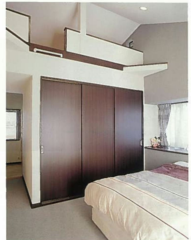
スリット出窓をつけた主寝室は、勾配天井を生かした開放的な空間に。奥にも同サイズのクローゼットが確保され収納力は抜群。