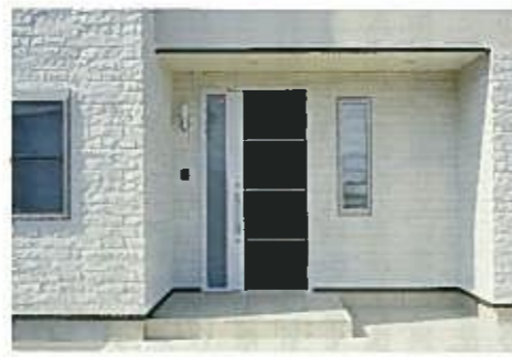
外壁に石をあしらってナチュラル感を演出。モダンなデザインのブラックドアでアクセントを。