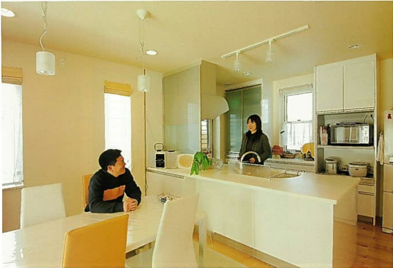
ホワイトで統一したさわやかなダイニング・キッチン 毎日使う場所だからと奥さまこだわりのダイニング・キッチン。対面式を採用したため、会話をしながら家事ができる。明るく清潔感にあふれている。