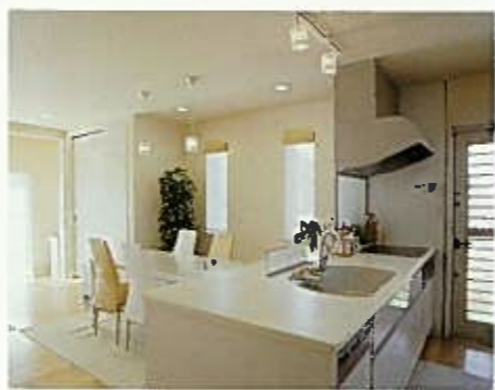
上/キッチンには、IHクッキングヒーターを採用。縦長窓を配し採光も十分。