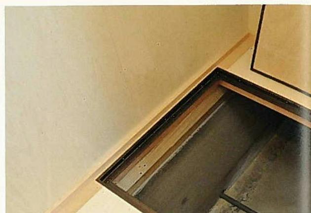
維持管理のため、床下寸法が確保されている。