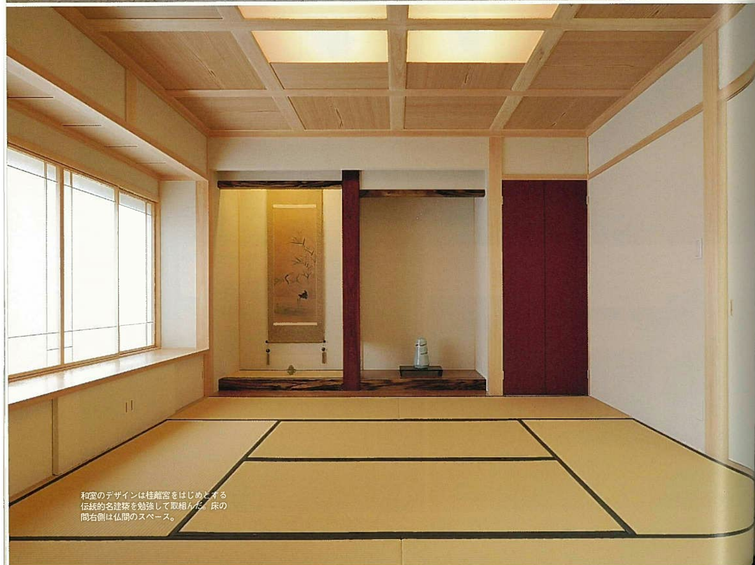
和室のデザインは桂離宮をはじめとする伝統的な建築を勉強して取組んだ。床の間右側は仏間のスペース。