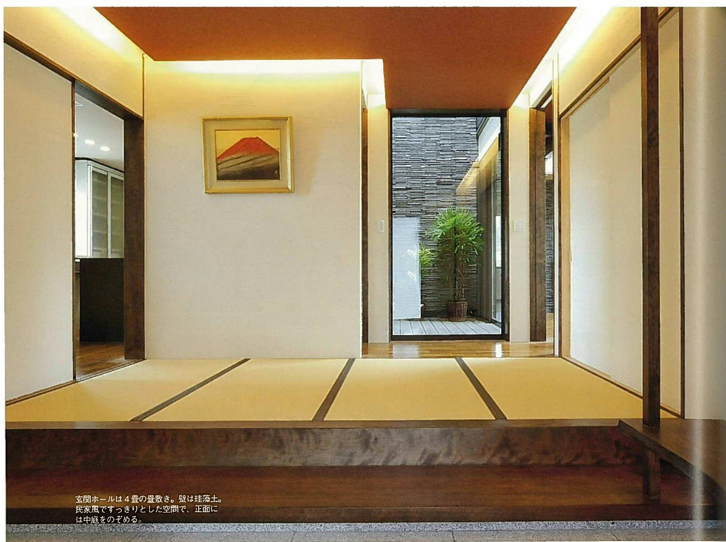
玄関ホールは4畳の畳敷き。壁は珪藻土。民家風ですっきりとした空間で、正面には中庭をのぞめる。