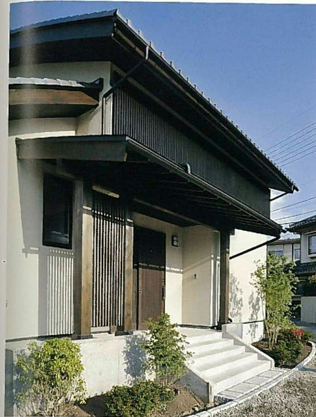
左/玄関ポーチには格子の目隠しを配置。2階部分西側の格子は、デザインであると同時に日射遮蔽の役割も。 右上/大屋根のどっしりした外観は周囲の田園風景にも調和。 右下/1階洋室南側には土間を設け、デッキまで連続させている。