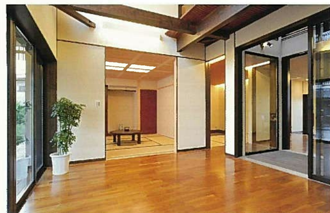
リビングから和室、玄関方面を見たところ。本格的な和室とも違和感なく連続する。