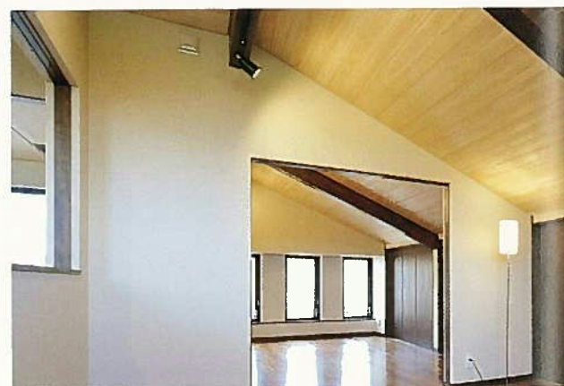
2階洋室。屋根の傾斜をそのまま利用。