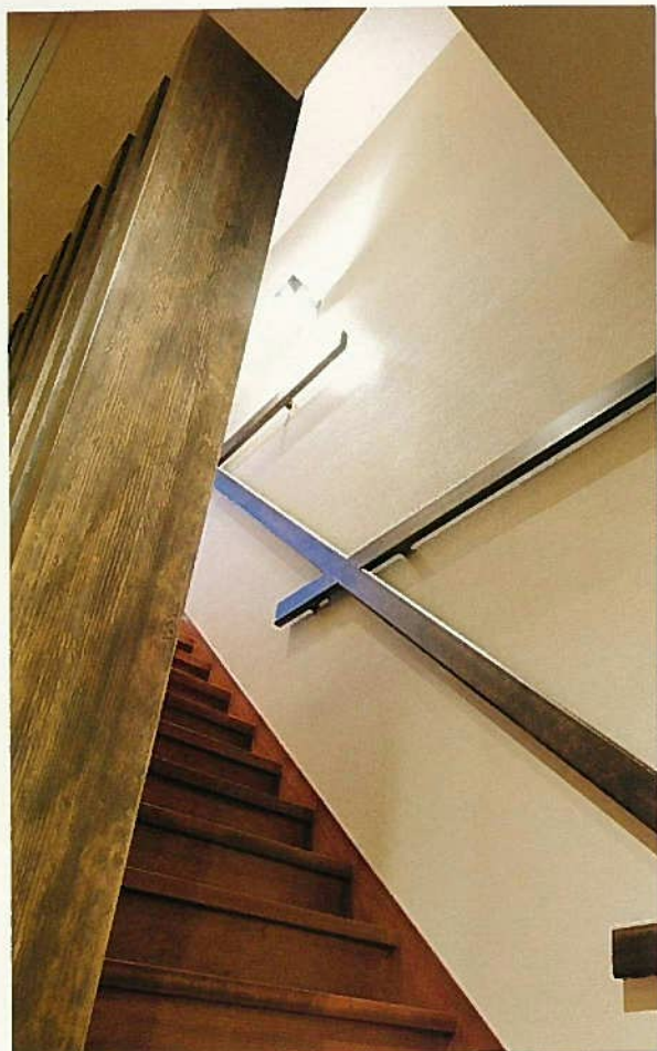
階段手摺につけられた水平な材は、ハンガーなどで衣類が掛けられる工夫。

「人も木も健康に暮らす」という考え 方にもとづいて、室内・床下・小屋裏・ 壁体内を一体と考え、外断熱と全熱交換 換気（国興システム）を採用。構造躯体 である木も通気により呼吸できるため、 吸放湿・森林浴効果を生み、室内環境を 整えます。室内すべての温度が一年中安 定するため、省エネやヒートショック防 止にもつながります。素材自体も住宅の 維持管理・メンテナンスがしやすく、長 持ちするものを選んでいきます。 モデル事業採択の大きなもうひとつの 柱である修繕積立金システムは、長期に わたる維持管理に対して資金的な裏づけ をもたせました。