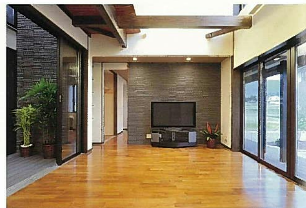
リビングは両側に開口部をもち開放的。