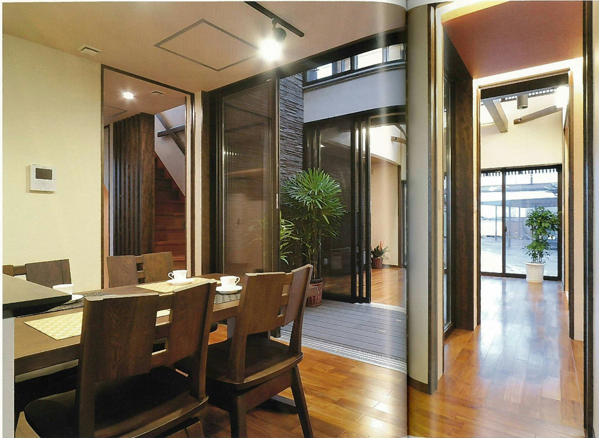
ダイニングから、上部が吹抜けとなった中庭を通して、リビングまでが回遊性のある一体の空間に。